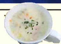
クラムチャウダー